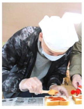
衛生面も大切です♪