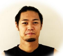
(2病棟) ますや 看護師