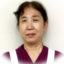
(2病棟) うえがき 看護師

南の島に興味があり関西から種子島に来ました。仕事の方も頑張ります。よろしくお願いします。