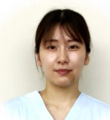
(1病棟) ますや 看護師