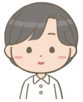
おかえりなさい！ (グループホーム一歩) ふかのき 世話人