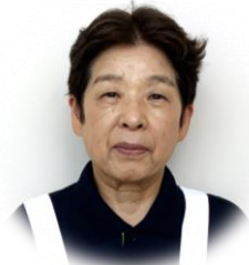
(2病棟) ながの 看護補助

常に患者様に寄り添ったケアを行うように心掛けています。これからも初診を忘れることなく頑張っていきたいと思ひます。