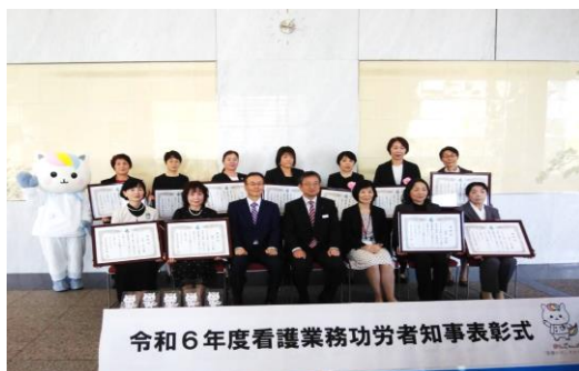
令和6年度看護業務功労者知事表彰式