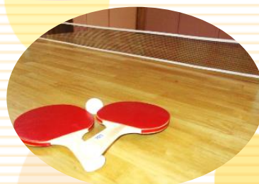
Table Tennis 卓球セット

ハワイ生まれの弦楽器です。コロコロとした優しい音色で心を癒してくれます。合唱部や様々なイベントで活躍！気軽に手に取って楽しめます。