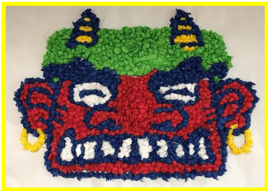
<2病棟 閉鎖> お花紙で、 『鬼』の壁面飾りを作りました。