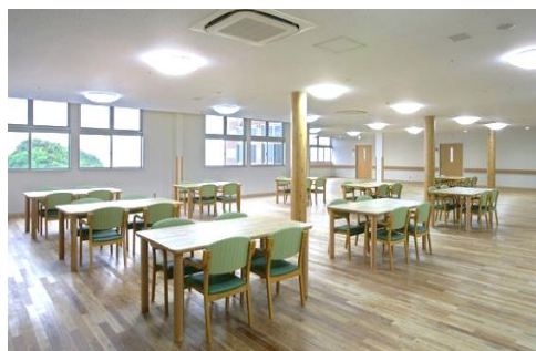
現在の病棟の内観