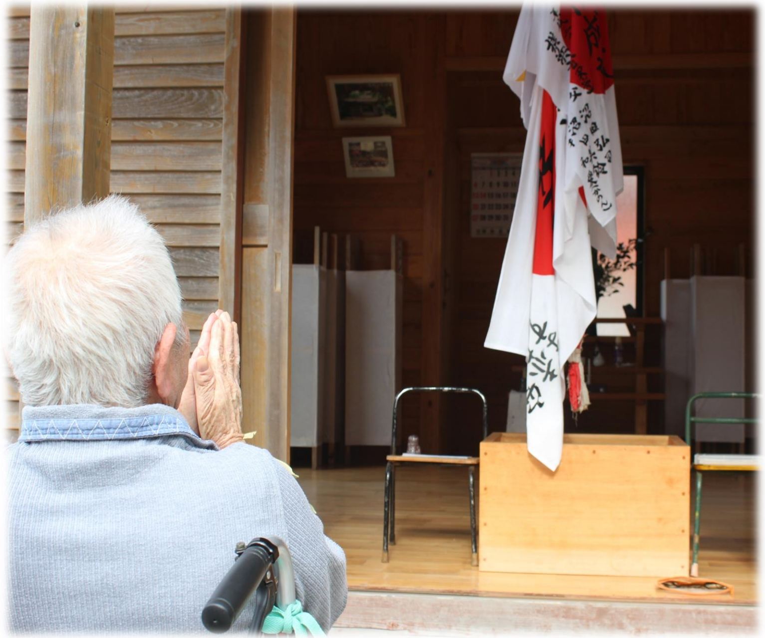
初詣に出かけた時の写真です