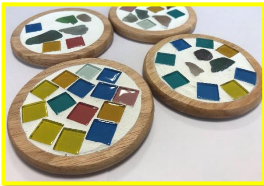
<2病棟 開放> タイルモザイクで、 コースターを作りました。