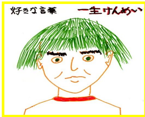
<デイケア> 利用者さんが、利用者仲間の 似顔絵を描きました。