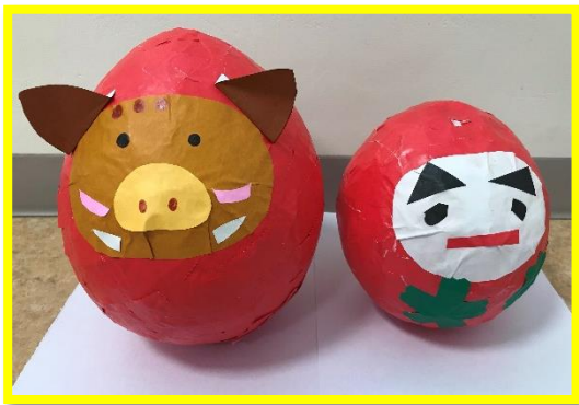
<2病棟 開放> 折り紙と風船で だるまの置物を作りました。