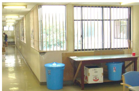
数年前の病棟の内観

去年の12月で20年以上勤務されていた職員が2名退職されました。退職された職員が、「10数年前まで、入院患者さんは最期まで入院させられて、退院なんて無理だと思っていたけど、病院が変わり、長く入院していた患者さんが退院し、街で生活しているのを見ると、感慨深いものがある」と話されています。近年、当院のグループホームが開所し、就労継続支援B型の作業所も開所しました。2病棟から退院され、地域へ社会復帰される患者さんがたくさんいらっしゃいます。地域に根付いた医療を目指し、今後も社会復帰に向けた看護に努めていこうと思えます。