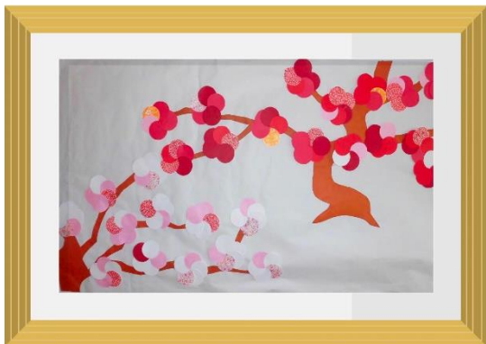
＜2病棟 開放＞ 色画用紙で 梅の壁面飾りを作りました。