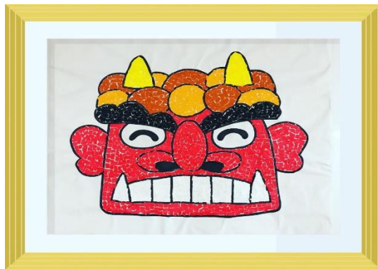
＜1病棟＞ 小さくちぎった折り紙で 赤鬼の壁面飾りを作りました。