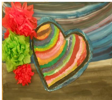
「夜空に浮かぶ花火」 とみひー