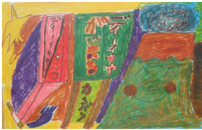
「がんばれや」 ヒロハミツユキ