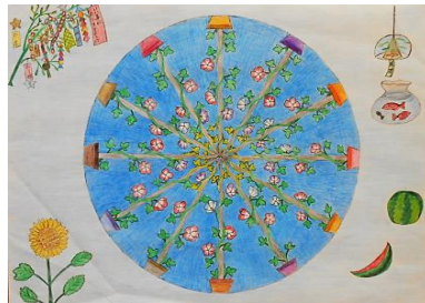
「7月の喜び」 かっこちゃん